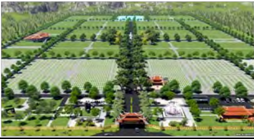
(Ảnh mô hình nghĩa trang cho các cán bộ cao cấp).

hectare, tương đương một phường lớn ở nội thành Hà Nội, dự án có vị trí ở huyện Thạch Thất, dưới chân núi Ba Vì, cách trung tâm Hà Nội 40km về phía tây. Thông tin từ bản quy hoạch cho thấy sẽ có 105 hộ dân phải di dời để nhường chỗ cho dự án.